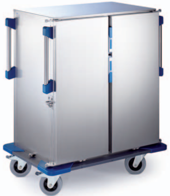
Chariot TTW-F 16-105 DSZG

Les nouveaux chariots de transport de repas avec refroidissement actif répondent parfaitement aux sévères normes d'hygiène, applicables en particulier aux repas froids.