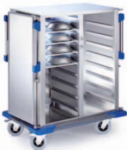
TTW-F 16-105 DSZG

Le refroidissement actif à air ventilé garantit la réfrigération continue des aliments froids en toute fiabilité et dans le respect des normes d'hygiène.