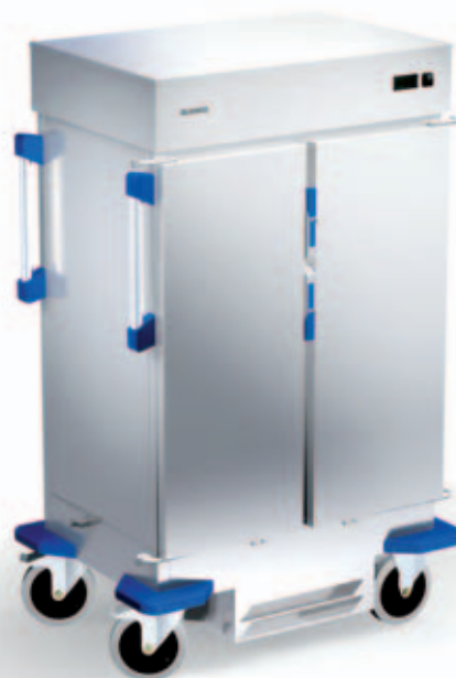
TTW-FK 16-115 DSZE

Ergonomie et compacité sous la bannière BLANCO INMOTION.