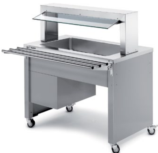
BASIC LINE SK-3 (côté client) Avec réfrigération active statique. Avec protection pare-haleine et glissière pour plateaux.