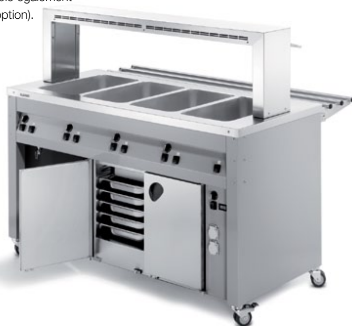
BLANCO BASIC LINE WU-4 (côté commande)

Avec plancher de base de grande surface (optionnel), côté client avec protection pare-haleine et glissière pour plateaux. Ici avec deux BLANCOTHERM 420 en position.