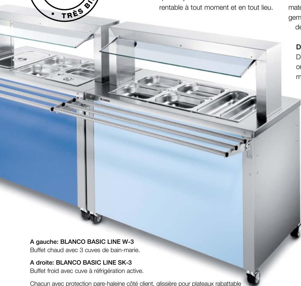
A gauche: BLANCO BASIC LINE W-3 Buffet chaud avec 3 cuves de bain-marie.

Transposition rapide et simple avec BLANCO BASIC LINE. Grâce au mariage d'une qualité élevée et d'une flexibilité élevée. Même des temps de planification courts garantissent une solution qui fait ses preuves à long terme.