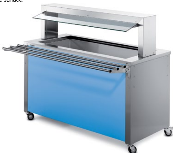
BASIC LINE UK-4 (côté client) Avec puissante réfrigération par air pulsé. Avec protection pare-haleine, glissière pour plateaux et habillage frontal optionnel.