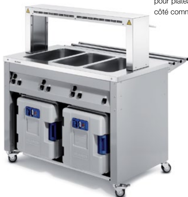
BLANCO BASIC LINE W-3 (côté commande)

Les buffets chauds sans soubassement chauffé sont disponibles en option avec un plancher de base qui vous offre un espace et des possibilités de rangement supplémentaires. Insérer, terminé! Par exemple le caisson de transport de repas tel que le BLANCOTHERM 420 pour un approvisionnement supplémentaire. Il permet également la distribution directe sans transvasement.