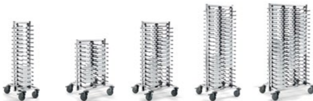
Abb. mit Zubehör Teller