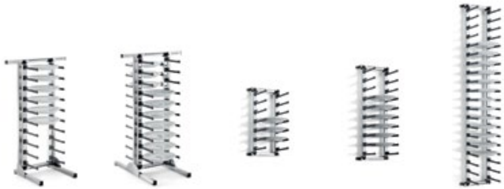
Abb. mit Zubehör Teller